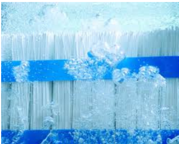
Membranes capillaires d'ultrafiltration prévues pour les applications BRM